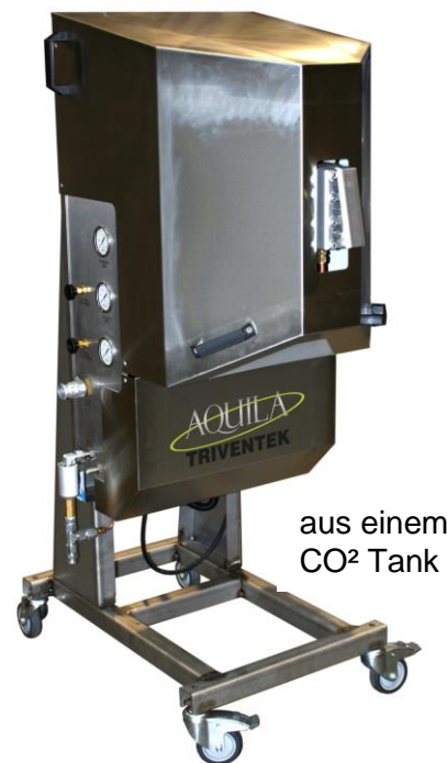
aus einem CO 2 Tank

Zur Herstellung Ihres Trockeneises benötigen Sie lediglich einen Gastank mit flüssigem CO 2 , was deutlich günstiger als Trockeneis selbst ist. Der Treventek Pellitizer produziert aus dem flüssigen CO 2 Trockeneis in sogenannte Pellets.